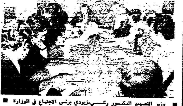
وزير التعليم الدكتور ركسي زويدي يبرش الاجتماع في الوزارة

توصية وقرارات والمقررات التي اتخذها المؤتمر هي التالية: ١ - ان المكتب الدائم لاتحاد الصحفيين العرب، يحرص على الصحافة اللبنانية الحرة والديمقراطية، ويشيد بنشاطها الوطني والديمقراطي، كما يدعو للتضامن مع الصحفيين الفلسطينيين في سجون الاحتلال الصهيوني، ويدعو الى اجراءات دولية لتفكيك الاحتلال الصهيوني، خاصة في الضفة الغربية والقدس المحتلة، والذين يتألمون من جراء الاحتلال الصهيوني. ٢ - يدعو المكتب الدائم لاتحاد الصحفيين العرب، الى استنكار الاساليب البربرية التي يمارسها العدو الصهيوني، وسياسة التمييز التي يمارسها العدو، ويظنون النظر الى خطورة هذه الممارسات. ٣ - يدعو المكتب الدائم لاتحاد الصحفيين العرب، الى استنكار الاساليب البربرية التي يمارسها العدو الصهيوني، وسياسة التمييز التي يمارسها العدو، ويظنون النظر الى خطورة هذه الممارسات. ٤ - يدعو المكتب الدائم لاتحاد الصحفيين العرب، الى استنكار الاساليب البربرية التي يمارسها العدو الصهيوني، وسياسة التمييز التي يمارسها العدو، ويظنون النظر الى خطورة هذه الممارسات.